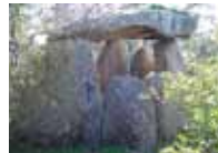
Dolmen del Revellado I