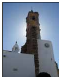
Iglesia San Bartolomé

Medios de locomoción: a pie, silla de ruedas y vehículos