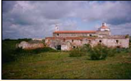
Convento de La Madre de Dios

Iniciaremos nuestra ruta por la calle Manuel Pinilla Hernández para coger el camino denominado El Yeye, tomando como referencia una pared de piedras a la izquierda, encontrándonos un paisaje impregnado del verde de los olivares y las huertas. Proseguimos la ruta haciendo una leve curva a la derecha para entrar en el Camino del Guadiana, llegando a un punto en el que la ruta se corta y debemos coger un tramo de camino privado pasando próximos al cortijo Pocacibera y atravesar una portera. Al pasarla continuamos girando suavemente a la izquierda siguiendo un sendero y atravesaremos una nueva portera, entrando en un paraje de dehesa impregnado de vegetación asociada, lugar donde se celebra todos los 15 de Mayo la Romería de San Isidro. Cruzaremos una portera más hasta llegar a ver un Refugio de trashumancia , el cual bordearemos haciendo un giro pronunciado a la izquierda. Este tramo de camino coincide con la Cañada Real de Sancha Brava, como se le denomina a la Cañada Real Soriana Occidental a su paso por la provincia de Badajoz. Trascorridos escasos metros llegamos a un merendero -en las inmediaciones del Pantano de Piedra Aguda - donde podremos hacer un descanso en nuestra ruta para comer y de paso visitar la Ermita de San Isidro , presidida en su interior por la imagen del santo que le da su nombre y lugar donde se celebra la misa de la festividad. Desde