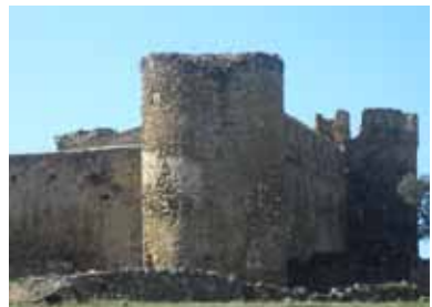
Castillo de Los Arcos

Medios de transporte: a pie, silla de ruedas y vehículos