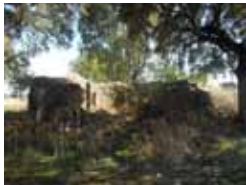
Restos Iglesia de El Revellado