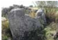
Dolmen del Revellado II