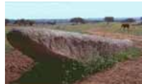
Menhir del Gamonal