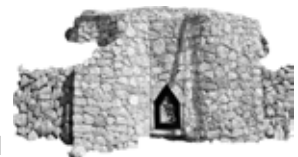
Horno de cal