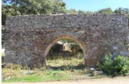
Ruinas de la Iglesia del Revellado

Esta ruta coincide en parte de su trayecto con la ruta megalítica; saldremos de la Iglesia de San Bartolomé para tomar la calle que tiene su nombre y continuamos por la calle Carrera, llegamos a la Fuente Goleta, cogemos la calle Riscos y posteriormente la calle San Roque. Al final de ésta atravesamos la calzada, giramos unos metros a la izquierda y cogemos el camino que sale a la derecha.