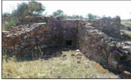
Horno de Cal

Comenzaremos nuestra ruta en la Iglesia de San Bartolomé , uno de los elementos patrimoniales más antiguos de la localidad comenzada a construir en los inicios del siglo XVI (1530 - 1535) y no concluida hasta el año 1776 tras años de inactividad. Consta de nave única, cabecera poligonal en ochava y capillas laterales adosadas, todas con cubierta de crucería de granito y un arco toral semiojival.