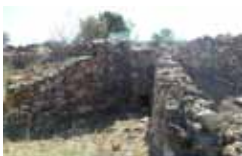
Horno de Cal